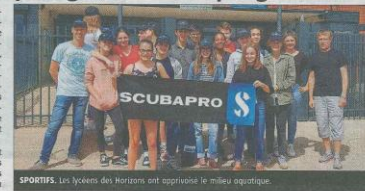
SPORTIFS. Les lycéens des Horizons ont approché le milieu aquatique.

Une équipe d'enseignants du lycée des Horizons avait imaginé cette année un projet pédagogique ambitieux permettant, via la pratique de la plongée subaquatique, de donner une dimension concrète aux enseignements de physique, mathématiques, science