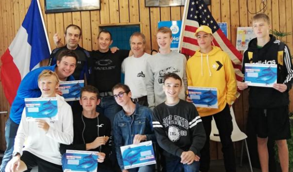
AG AURA 2019 Section jeunes